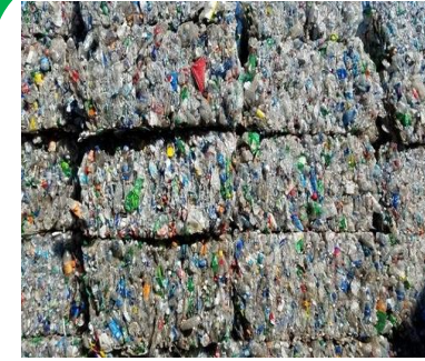
Reúso de residuos Sólidos y líquidos