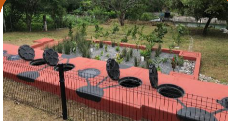
Manejo de aguas residuales