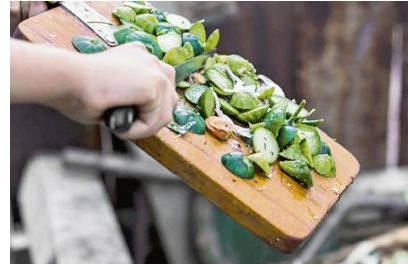
Manejo de residuos sólidos