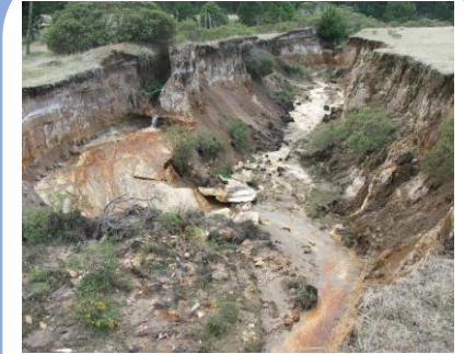
Manejo de aguas pluviales