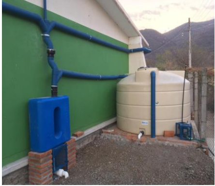
Provisión de agua